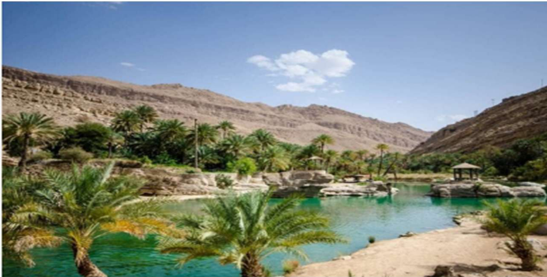
Vallée du Drâa (Zagora)

Après le petit déjeuner, chargement des bagages puis départ pour une marche d'environ 4 heures avant de rejoindre nos cuisiniers pour le déjeuner.