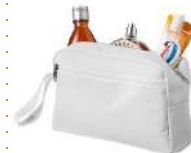
Trousse de toilette