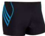
Maillot de bain