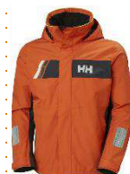
Veste imperméable- Anorak