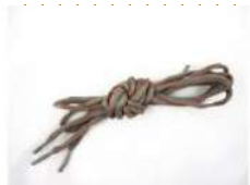
lacets de rechange