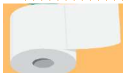
Du papier toilette